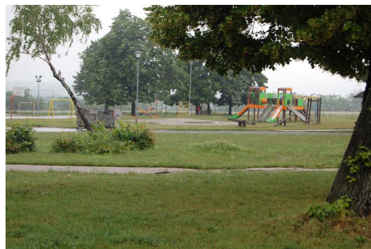
Dom za decu i omladinu ometenu u mentalnom razvoju „Veternik“ u Novom Sadu