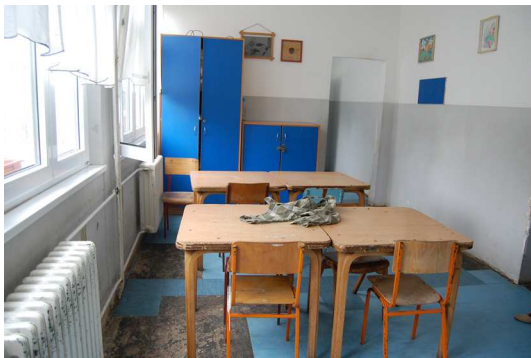
Dom za decu i omladinu ometenu u mentalnom razvoju „Sremčica“ u Beogradu